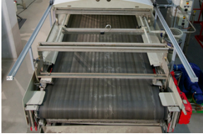
Déchargement du gâteau