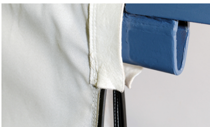
Conception d'étanchéité optimisée