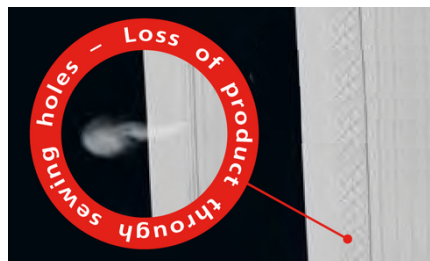
Pas de perte de produit grâce à la technologie de soudure Sefar (pas de trous de couture)