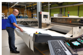
Housses de secteur