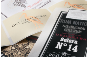
© Marbau GmbH & Co. KG