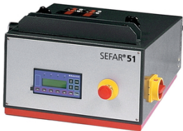
L'unité de commande électronique simple ou double circuit programmable

En matière de systèmes de tension pneumatiques il existe deux possibilités d'alimentation en air comprimé: les systèmes à circuit simple ou double – deux possibilités complémentaires pour obtenir des tensions optimales et équilibrées avec tous types de tissu et de taille de cadre. Les systèmes à circuit simple sont recommandés pour des cadres ayant des côtés jusqu'à 150 cm. Au delà de 150 cm les systèmes a double circuit sont recommandés.