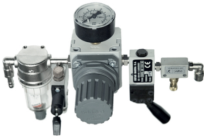
L'unité de commande simple combinée avec SEFAR 3A