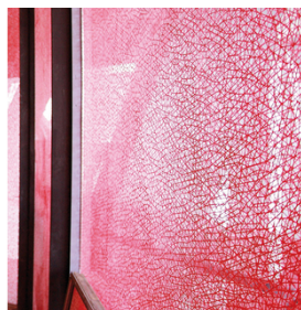
Pour une image imprimée résistante et précise des façades vitrées SEFAR GLASSLINE 68/175-95W