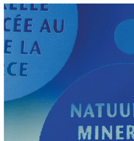
Des couleurs brillantes et des bords d'impression nets avec des encres UV. Imprimé avec SEFAR PCF 120/305-34Y