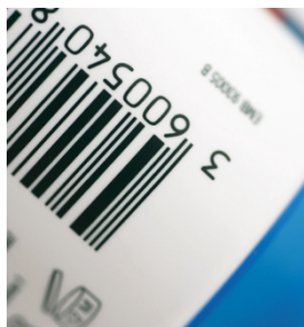
Codes barre nets et denses imprimés avec SEFAR PA