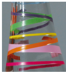
Contours nets et très denses avec SEFAR PA