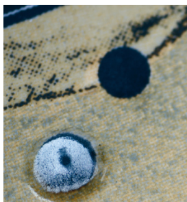
Carrelages structurés et très résistants avec SEFAR PA

SEFAR PA convient aux applications faisant appel aux encres très abrasives et là où l'écran doit épouser la forme des supports à imprimer: par exemple en impression sur carrelages, ou sur flacon plastique ou verre.