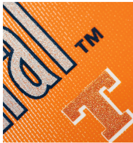
Texte net et très lisible sur étiquettes imprimées avec SEFAR PCF FC