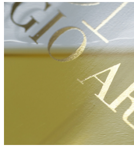
Lettres très denses et nettes sur flacon de parfum avec SEFAR PCF FC