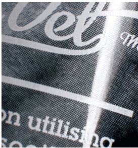
Qualité d'impression exceptionnelle de trames fines sur tube plastique avec SEFAR PCF FC

Augmentez vos choix avec SEFAR PCF pour la sérigraphie sur flacon plastique, étiquettes, verre creux, disque optique et de nombreux autres supports d'impression difficiles.